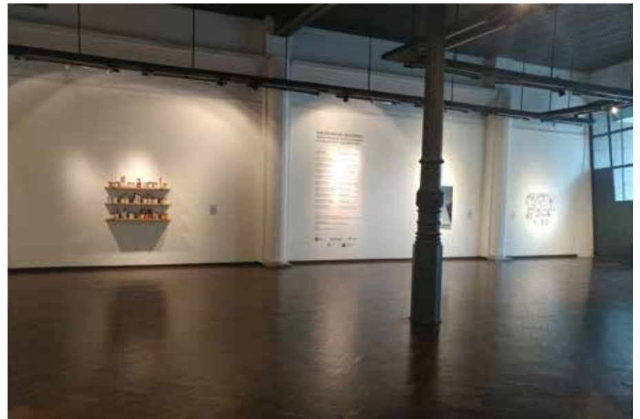
Sala A, desde arco de Sala A