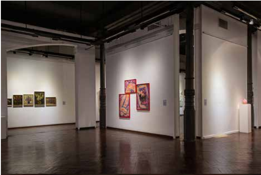
Ángulo de paredes y arco de Sala A y Sala B, hacia Sala D desde Sala A