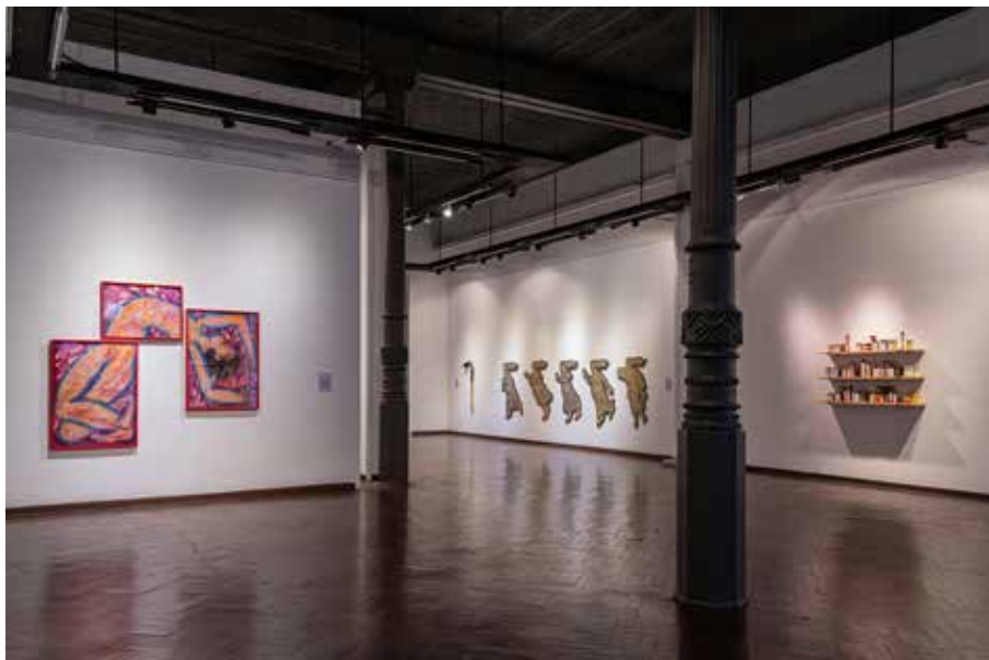
Sala A y pared de Sala B, desde Recepción