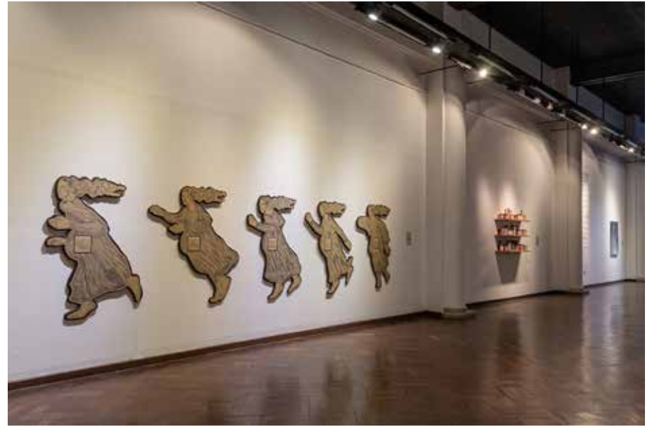
Pared larga Sala B y Sala A, desde Biblioteca hacia la entrada