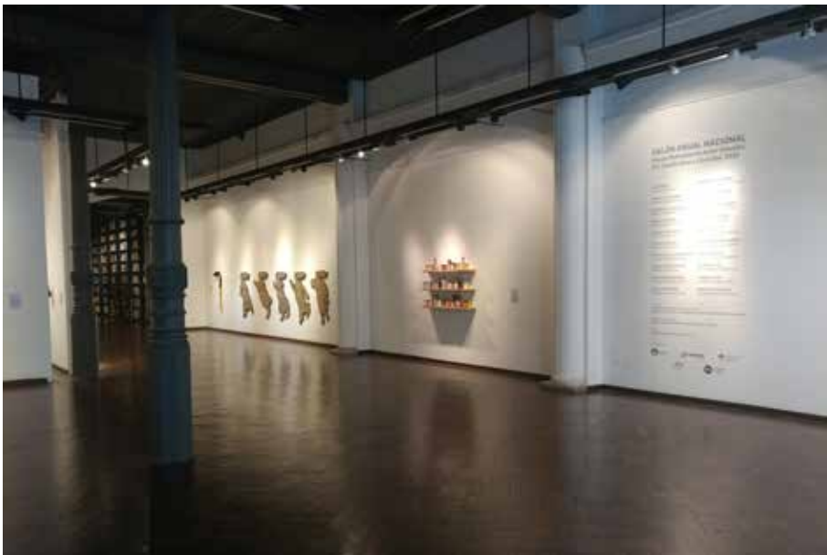
Pared larga Sala A y Sala B, desde Recepción hacia Biblioteca