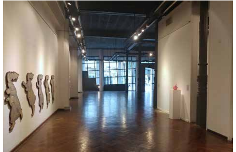
Sala B y Sala A, desde Biblioteca hacia la entrada