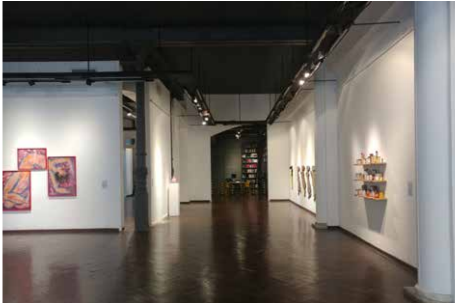
Sala A y Sala B, desde la entrada hacia Biblioteca