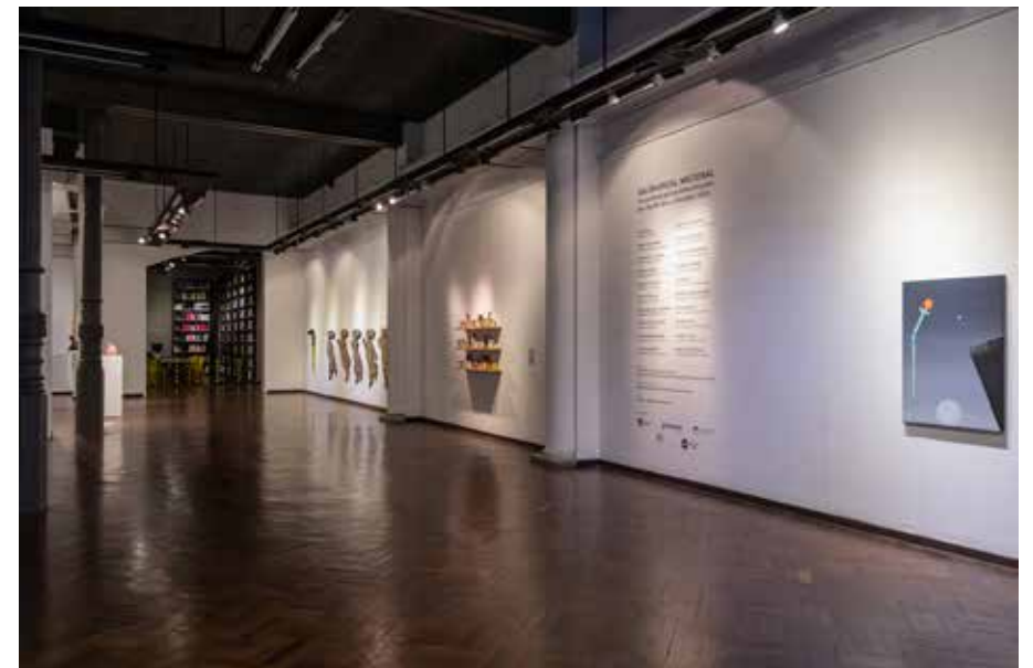
Pared larga Sala A y Sala B, desde Sala A hacia Biblioteca