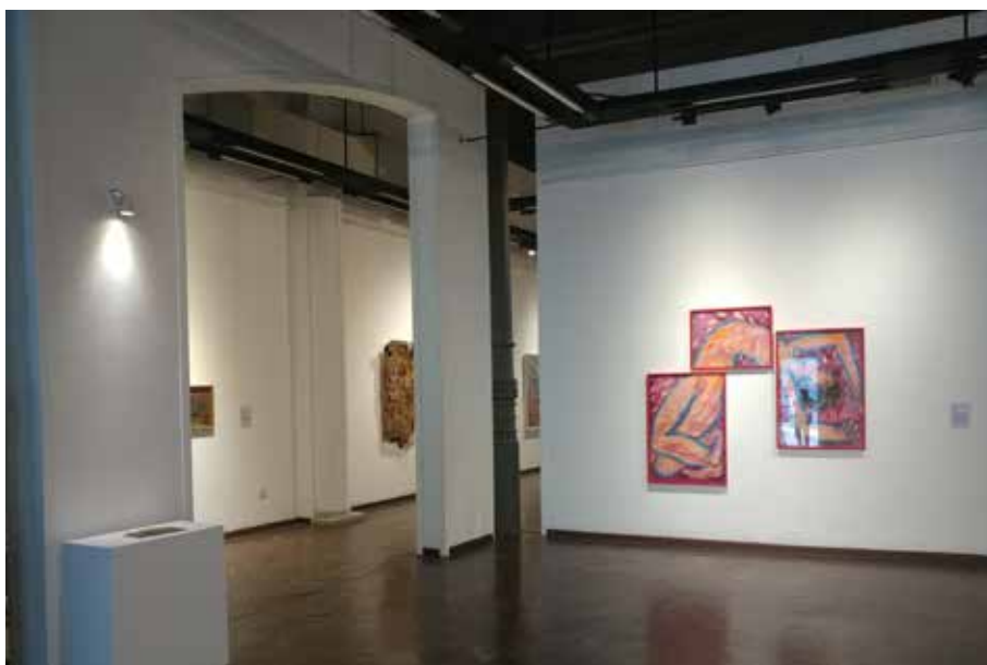
Arco de Sala A, desde Sala A