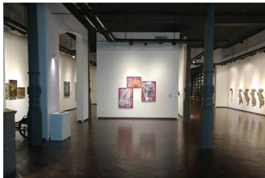
Sala A con arco, sala B, desde la entrada hacia Biblioteca y Sala D